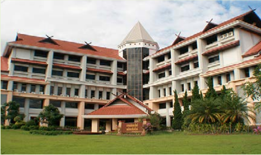
รวบรวมโดย เพ็ญนภา กันทะตา

มหาวิทยาลัยเปรียบเสมือนศูนย์รวมของมันสมองของชาติ เป็นที่รวมขององค์ความรู้ การค้นคว้าและการวิจัย เพื่อใช้ในการผลิตมันสมองของชาติรุ่นต่อๆ ไป จุดด้อยของการเป็นมหาวิทยาลัยของรัฐซึ่งมีความเป็นราชการ คือการบริหารงานและบุคลากรที่ยังอยู่ในกรอบปฏิบัติของระเบียบราชการที่ก่อให้เกิดความล่าช้าและความไม่คล่องตัวในการขับเคลื่อนมหาวิทยาลัยและการพัฒนาองค์ความรู้ต่างๆ ให้ทันต่อการเปลี่ยนแปลงของสังคมทั้งในประเทศและต่างประเทศ