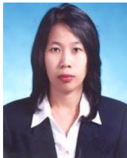
สำนักหอสมุด